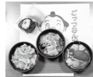
▲なる子ちゃんご鍋イメージ

市の新たな郷土食として名産にすべく、普及と提供店の拡大を推進する宮城野部屋直伝の「なる子ちゃんご鍋」と「大崎の地酒」を味わってみませんか。