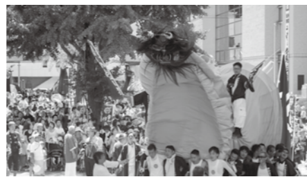
▲全長5~6mで鬼のような顔と牛の胴体を持つ「牛鬼」が練り歩く「うわじま牛鬼まつり」