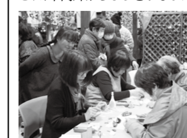
▲作って楽しめるひな飾り

「まちの駅」として古川地域の醸室 寺子屋ホールで展示されているつるし雛は、およそ1万3千点と、県内でも随一の規模を誇ります。展示室内では、初心者でも気軽にひな飾りを作ることができるワークショップなども開催され、市内外からひっきりなしにファンが訪れます。