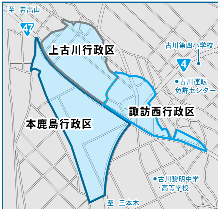
■ 分区する上古川・本鹿島・諏訪西行政区