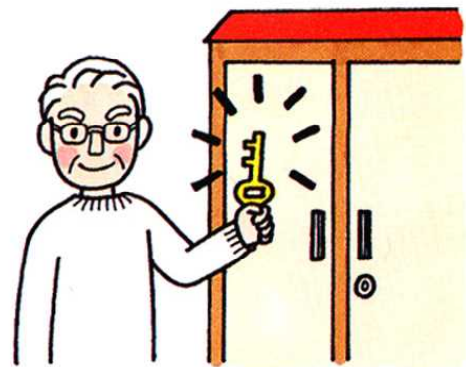
物置・車庫には鍵を