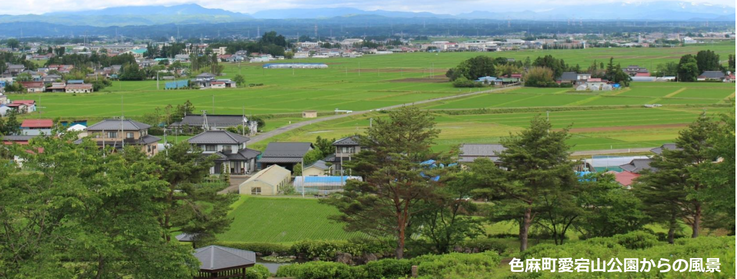
色麻町愛宕山公園からの風景

昔から途絶えることなく続けられてきた 大崎耕土の農業の営み や 農村の伝統文化 、豊かな 生物多様性 などを未来に残し、伝えるべき大切な農業システムとして「 世界農業遺産(GIAHS) 」 認定 を目指しています。