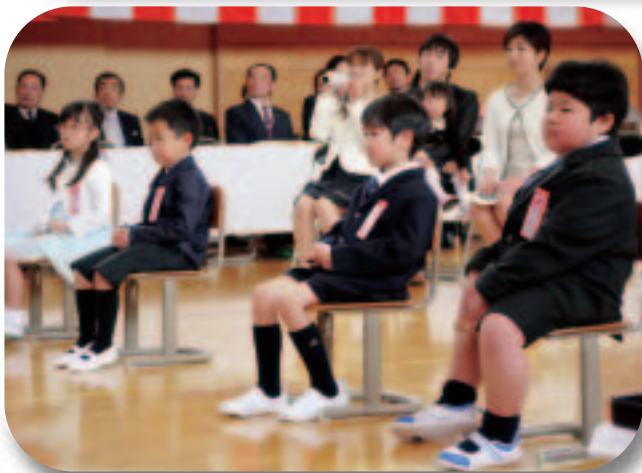
下伊場野小学校入学式