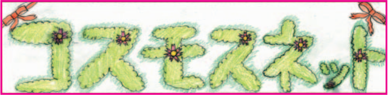
題字：松山小学校 高橋 璃星さん 作