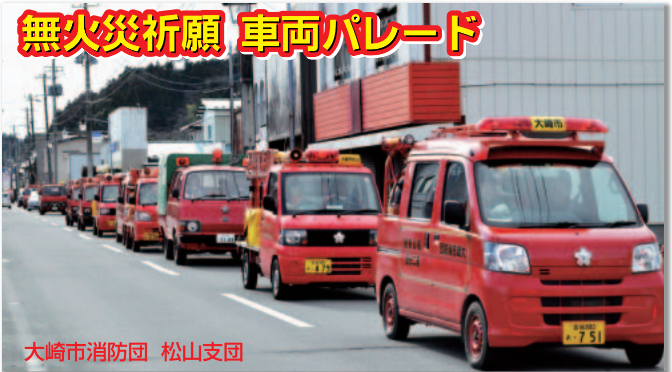
大崎市消防団 松山支団