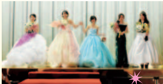
自作のウエディングドレス