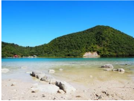
優秀賞「和み～何気ない日常～」 古川工業高等学校2年菅原大河 “誇れる風土”より