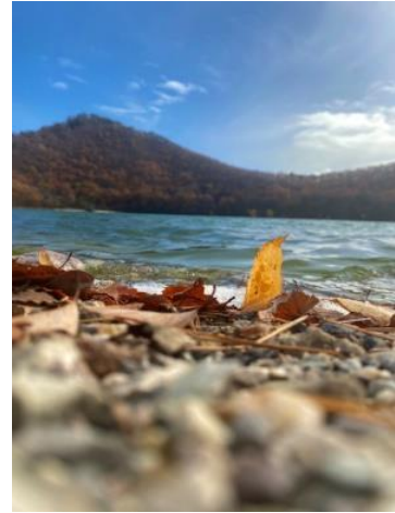
優秀賞「潤う大地」 古川工業高等学校2年大場瑞季 “考え学び豊かな心で大崎をたがやします”より