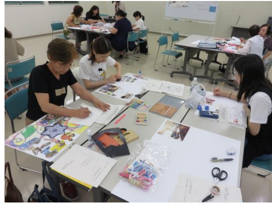
写真や雑誌の切り抜きなどを使って自由にデコレーション