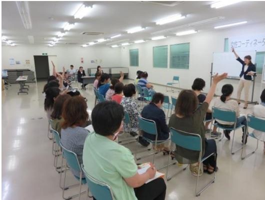
毎回楽しいアイスブレイク