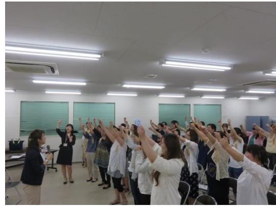
前向きな言葉で、相手も自分も元気に！