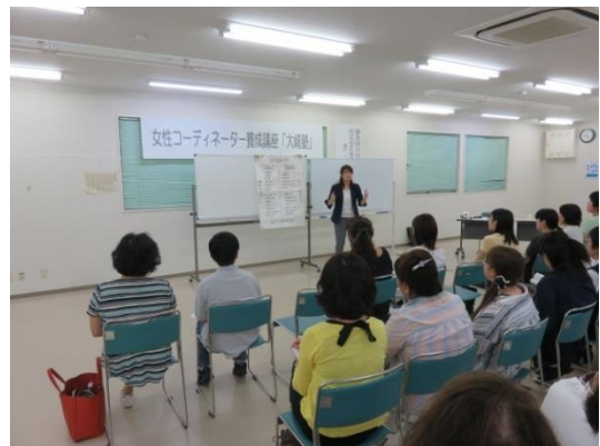
相手のタイプを知れば付き合い方が楽しくなります