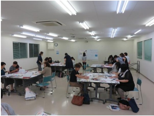
夢が叶うシンデレラマップ作り