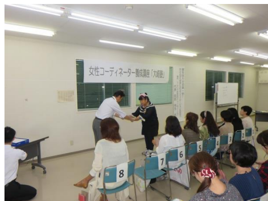
閉講式では、発表者全員に他の受講生からメッセージカードの贈り物（涙）！