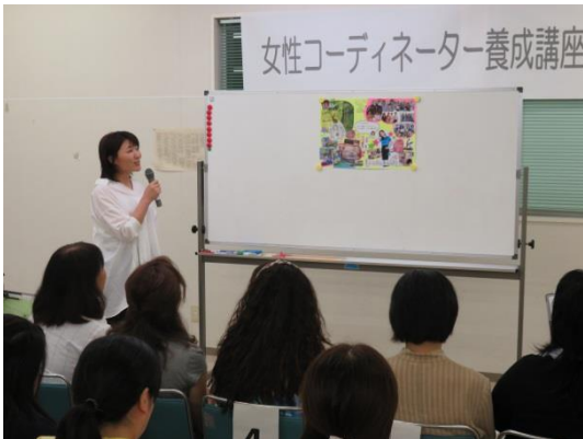
シンデレラマップの発表会