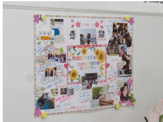
なりたい自分への羅針盤！魔法のマップ