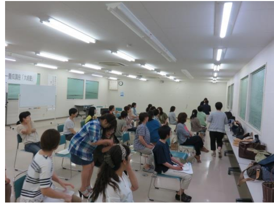
大笑いのジェスチャーゲーム