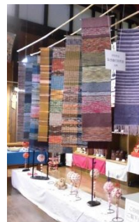
※昨年展示された共同作品