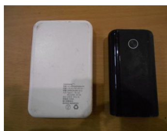
モバイルバッテリー