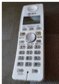
コードレス電話機