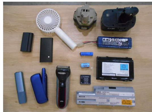
リチウムイオン電池使用例

○リチウムイオン電池は オレンジ色の「小型家電・乾電池」 のボックスに入れてください。