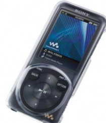
ポータブルオーディオプレーヤー