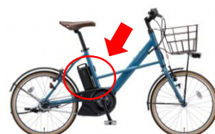
電動アシスト付き自転車のバッテリー