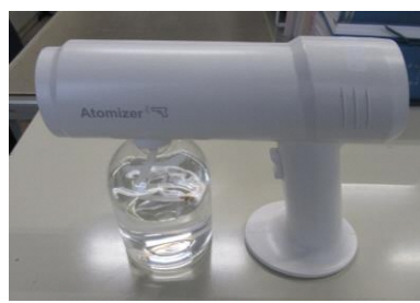
コードレス噴射機