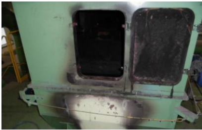
ベルトコンベア上部

令和5年7月7日、大崎広域リサイクルセンターでベルトコンベアの一部が焼損する火災が発生いたしました。発火原因はリチウムイオン電池によるものと判定されております。