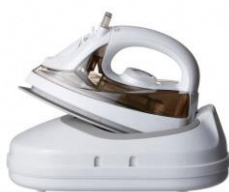
コードレススチームアイロン