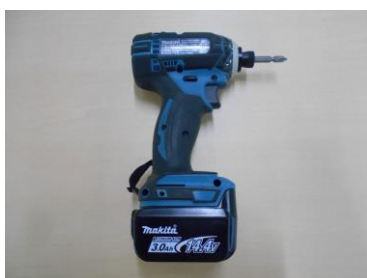
電動式ドライバー