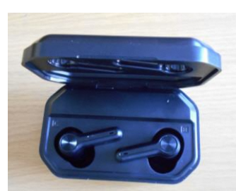
ワイヤレスイヤホン