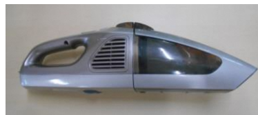
コードレス掃除機