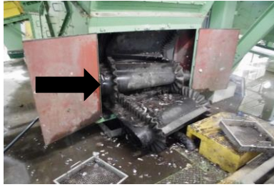
焼損・脱落したベルト

リチウムイオン電池は、充電して何度も使用できる製品やコンセントから抜いても使える製品に多くに使われており、強い衝撃や圧力が加わることで発火し 大変危険 です。