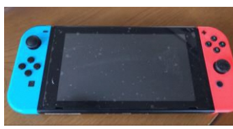
ポータブルゲーム機