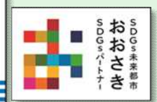
ロゴマーク の使用