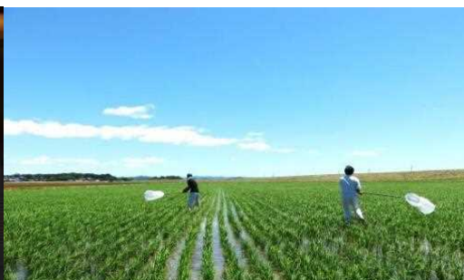
生きものモニタリング調査