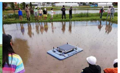
スマート農業(アイガモロボット)