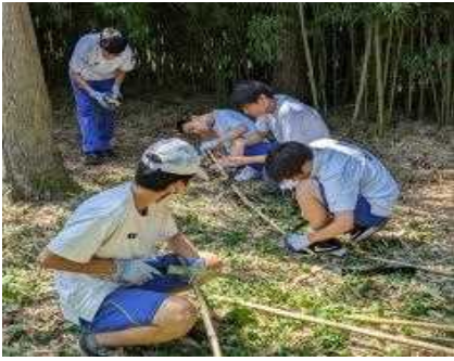
屋敷林「居久根」の保全作業