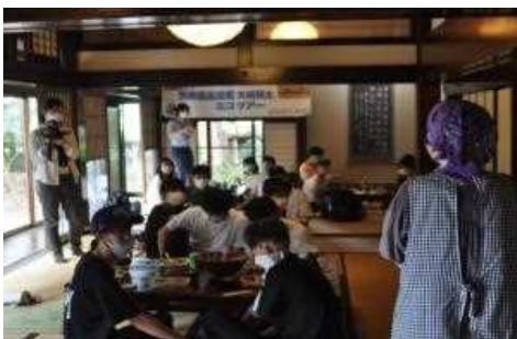
ずんだもち作り体験