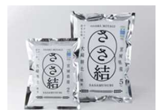
農業生産物の販売