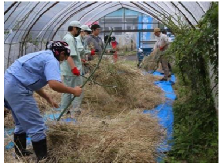
伝統野菜鬼首菜の採種作業