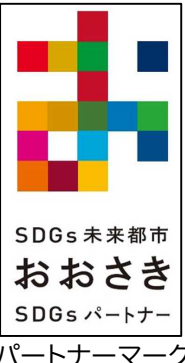
(パートナーマーク)

<パートナーマークのデザインイメージ> 田んぼをモチーフに大崎市の「お」を表現しています。また、「お！」は、驚きや感嘆の言葉でもあり、SDGs未来都市・大崎らしい持続可能な「お」を、みんなでつくっていこう、という願いが込められています。