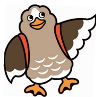
大崎市イメージキャラクター パタ崎さん