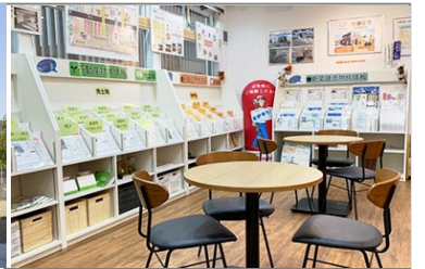
不動産情報閲覧スペース