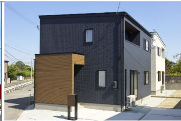
【分譲住宅】JUST in HOME