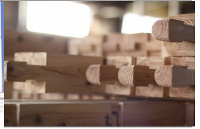
本社工場で木材を加工