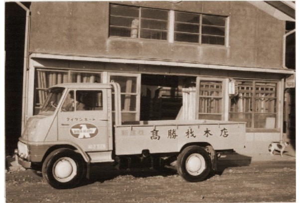
1955年に高勝材木店として創業。(創業当時の写真)