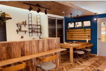
ショールーム内観