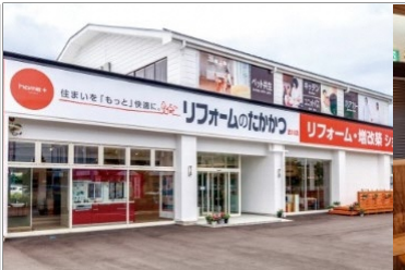
本社/リフォームショールーム

増改築のリフォームのたかかつ、屋根外壁塗装、水廻りリフォーム専門店を展開中。トラブル発生時もすぐに対応できるよう、エリアを絞り地域密着がコンセプト。