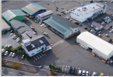
本社工場/建築資材倉庫

地元で伐採された原木の製材、乾燥、加工まで自社工場で一貫して行う。木材のみならず、建材卸事業で家づくりのプロへ資材販売も行っている。