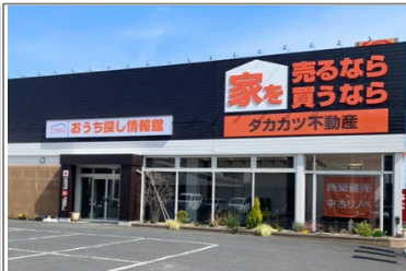
古川支店/ショールーム

古川と仙台の2店舗体制。土地建物の売買や仲介はもちろん、分譲住宅の企画・施工・販売も行う。中古住宅のリノベーションも行っている。