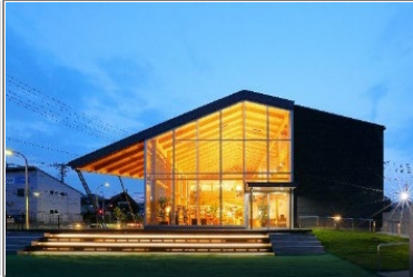
WOOD EGG GARDEN仙台

多様な価値観・好み・理想の暮らし方にフィットするブランドを複数ラインナップ。STAND BY HOMEはウッドエッグプロジェクトから生まれた自社開発のオリジナル商品。