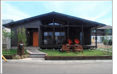
【企画住宅】STAND BY HOME