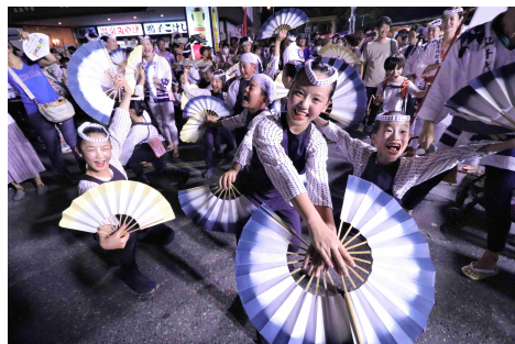
令和5年度 【一般部門】優秀賞 「鳴子から雀踊りの贈り物」