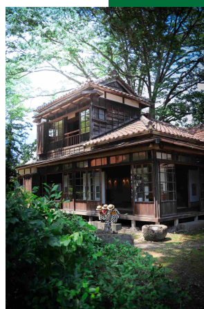
令和5年度 【一般部門】優秀賞 「風の通り道」