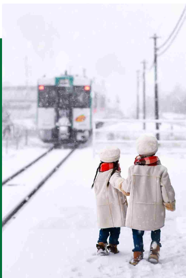
令和5年度 【一般部門】最優秀賞 「雪景色と列車」