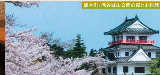
涌谷町・涌谷城山公園の桜と史料館

涌谷町 (わくやちょう) 日本初の産金地として知られる。歴史と自然に恵まれた町。 【まちづくり推進課】 ■電話 / 0229-43-2119 ■HP / http://www.town.wakuya.miyagi.jp/