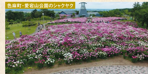
色麻町・愛宕山公園のシャクヤク

色麻町 (しかまちょう) 5月下旬~6月上旬の開花時期には、約1万株のシャクヤクの花が咲き誇る。 【産業振興課】 ■電話 / 0229-65-2128 ■HP / http://www.town.shikama.miyagi.jp/