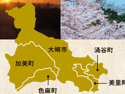
加美町・初午まつり「火伏せの虎舞」

涌谷町 (わくやちょう) 日本初の産金地として知られる。歴史と自然に恵まれた町。 【まちづくり推進課】 ■電話 / 0229-43-2119 ■HP / http://www.town.wakuya.miyagi.jp/