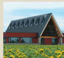
北欧の風 道の駅とうべつ

鳴子温泉地域に多い「遊佐」姓を縁として1992年に兄弟町提携。日本百名山の鳥海山や日本海、庄内平野に抱かれた自然豊かなまち。