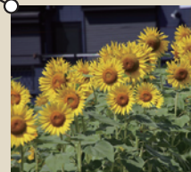
大賀の郷・3万本のひまわり畑

「田尻」という自治体名を縁として都市交流が始まり、1991年に友好都市提携。関西国際空港があり、田尻スカイブリッジの景観が美しいまち。