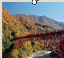
黒部峡谷トロッコ電車

東北新幹線開業を縁として都市交流が始まり、1984年に姉妹都市提携。日本を代表する観光地上野・浅草がある歴史・伝統・文化多彩なまち。