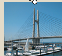
田尻スカイブリッジ&たじり海の駅

宇和島藩初代藩主秀宗公と岩出山初代領主宗泰公が兄弟という深い縁により1999年に姉妹都市提携。真珠や魚の養殖、みかんなどの産業が盛んな城下町。