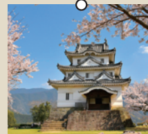
国指定重要文化財 宇和島城天守

YKKグループ企業が立地する縁で交流が続き、2021年に姉妹都市提携。黒部峡谷や黒部川扇状地湧水群など雄大な自然に出会えるまち。