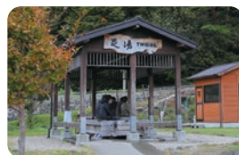
足湯 下地獄源泉 (あしゆ しもじごくげんせん)

鳴子温泉湯めぐり駐車場そばにある足湯。街歩きや運転で疲れた足を癒すのにぴったり。