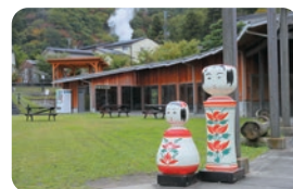
鳴子温泉ゆめぐり広場 (なるこおんせん ゆめぐりひろば)

☎大崎市鳴子温泉字新屋敷67-7 ☎0229-83-4751 (鳴子まちづくり株式会社) ☎8:30~17:00 ※季節によって変動あり ☎無休