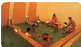
鳴子・早稲田栈敷湯 (なるこ わせださじきゆ)

☎大崎市鳴子温泉字新屋敷124-1 ☎0229-83-4751 ☎9:00~21:30(最終入館21:00) ☎無休 ☎大人660円、小人330円