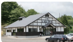
しんとろの湯 (しんとろのゆ)

☎大崎市鳴子温泉字星沼18-9 ☎0229-87-1126 ☎9:00~20:30(最終入館20:00) ☎無休 ☎大人500円、小人250円