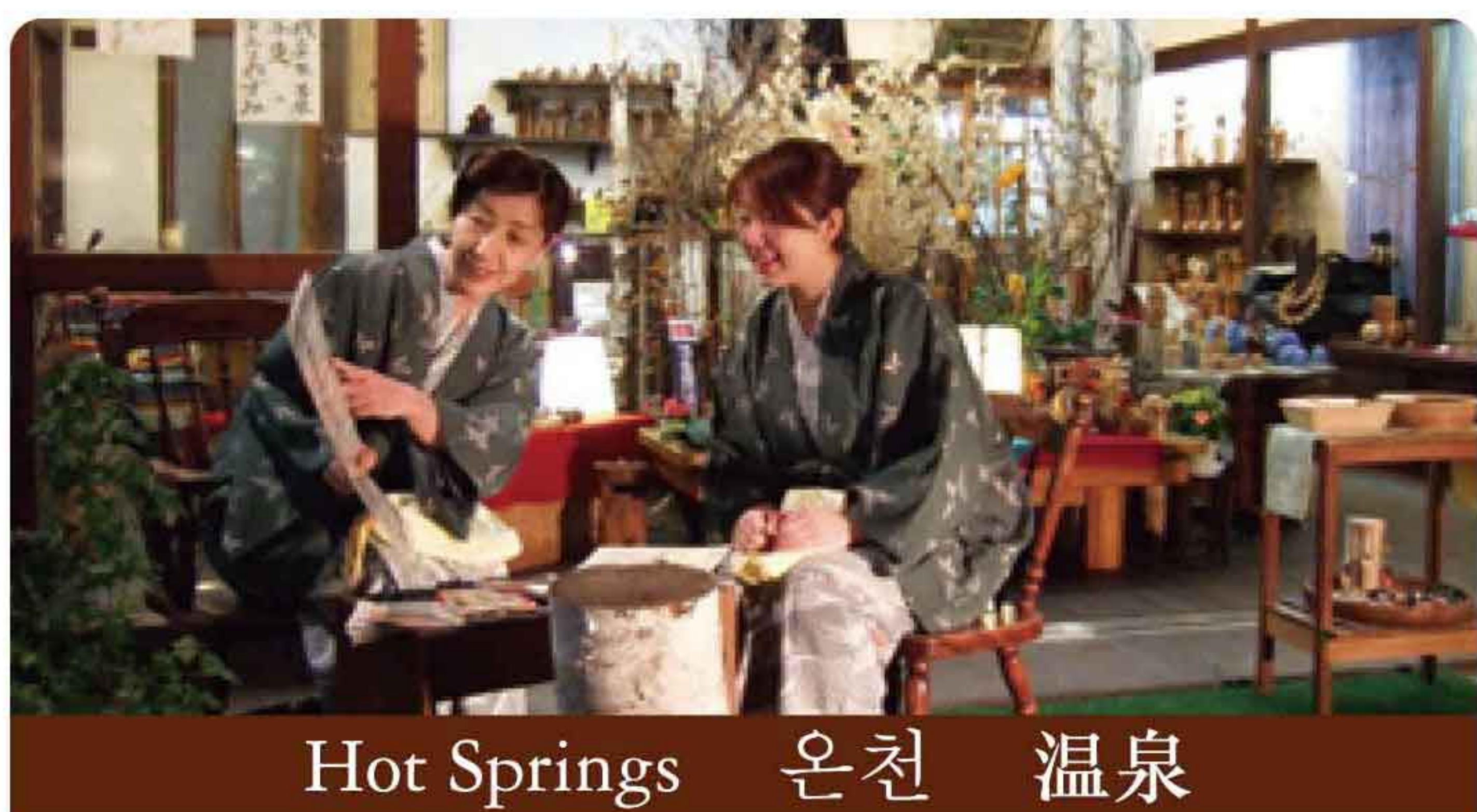
Hot Springs 온천 温泉