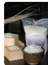
自然にも人にもやさ しい無農薬米