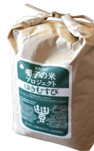
絆が結んだ鳴子の 米プロジェクト