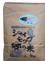
シナイモツゴへの愛 が良質な米を育む