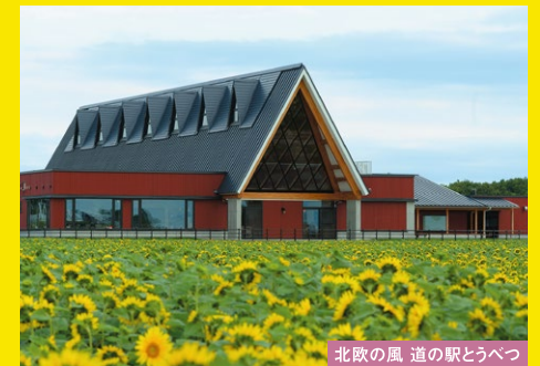
北欧の風 道の駅とうべつ

明治4年に仙台藩の一門である岩出山領主伊達邦直公が家田を率いて入植。2020年に開拓150年を迎える。札幌市の北に隣接し、北欧の風道の駅とうべつを中心に田園風景が広がり、基幹産業の農業を生かしたまちづくりを進めている。