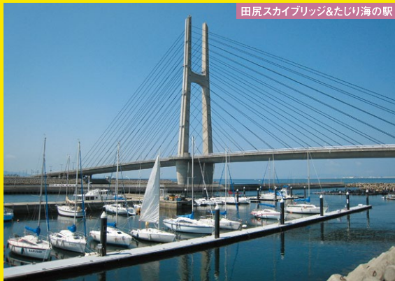
田尻スカイブリッジ&たじり海の駅