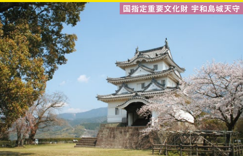
国指定重要文化財 宇和島城天守

秋田県との県境に位置し、日本百名山の鳥海山や日本海、庄内平野に抱かれた自然豊かなまち。鳥海山へ降る雪は長い年月をかけ地面から湧き出す湧水となり、まちの至る所で湧き出ている。湧水や井戸、滝の多さから「湧水の里」とも呼ばれている。