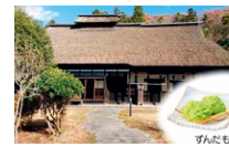
【大崎市】 旧千葉家住宅 ずんだもち手作り体験