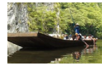
【一関市】 狢鼻溪舟下り