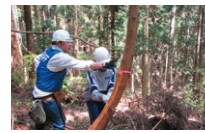
【最上町】 森の暮らしから学ぶ「SDGs」

自然に触れると同時に、世界遺産や伝統文化も学ぶことができるコース。農家・林業体験を通して、自然との関りや自然保護への意識を高め、日本の歴史や文化について考えてみよう!