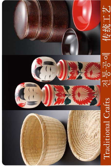
Traditional Crafts 전통공예 传统工艺