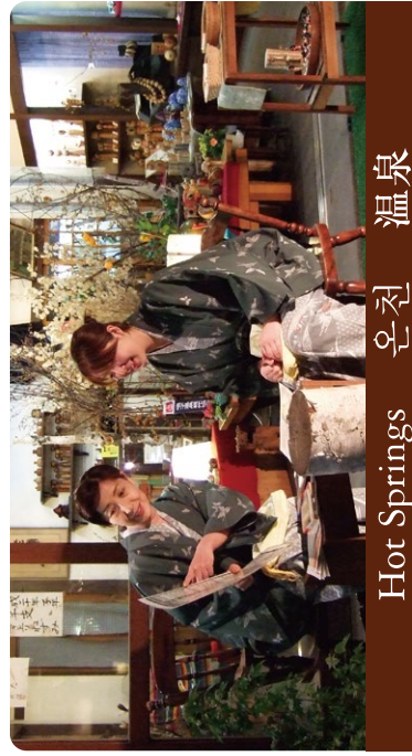
Hot Springs 온천 温泉