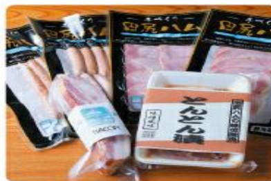
■田尻手作りハム (はじりてづくりはむ)