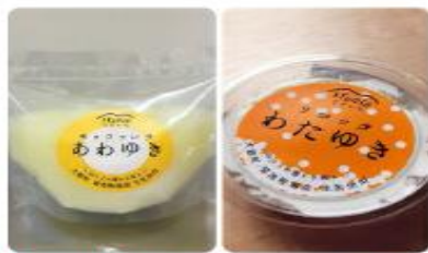
■STUDIO どといち (ずのいち)

2018大崎耳よりガイドブックへのスマートインター周辺エリアガイドへの掲載について・・・(長者原)