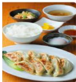
■点心ファクトリー すずかけ