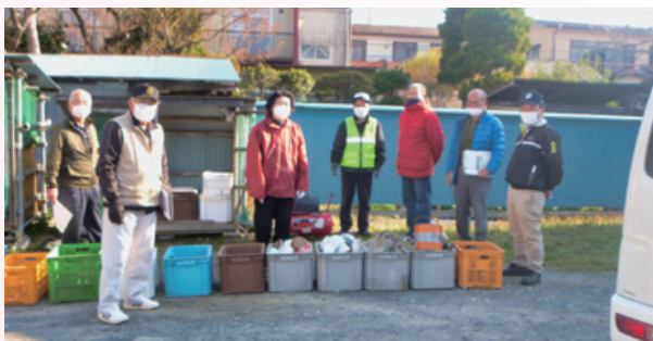
町区 ゴミ分別出前講座

4月20日、町区・上野合同ごみ集積所において今年度最初のごみ分別出前講座を行いました。当日は燃えないごみ・ビン・缶類の回収の日で、5名の生活環境部会員が分別に立ち会い、また『使用済み天ぷら油回収について』のチラシを渡してPRしました。