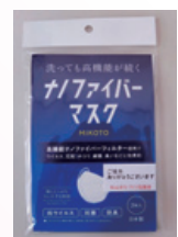
御 礼 品 マ ス ク