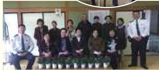
お茶会とても楽しかったです