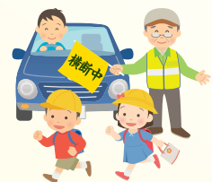
交通安全をお願いします