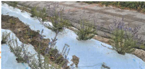
今年の ロシアンセージ

昨年・今年とコスモスロードの一角に植栽したロシアンセージが順調に育っています。今年は、天候に不安があり成長を心配していましたが、昨年のは春先から花が咲き大きな株に成長していて、今年のもも、株としてはやや小振りながら紫色の花を咲かせています。花は11月頃まで楽しめます。