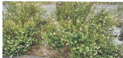
2年目大きく なりました