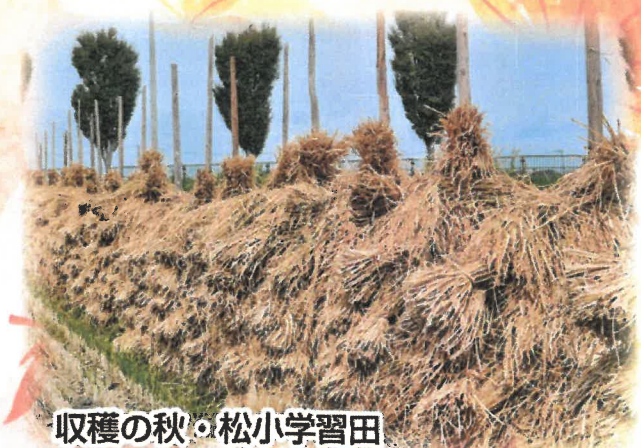
収穫の秋・松小学習田