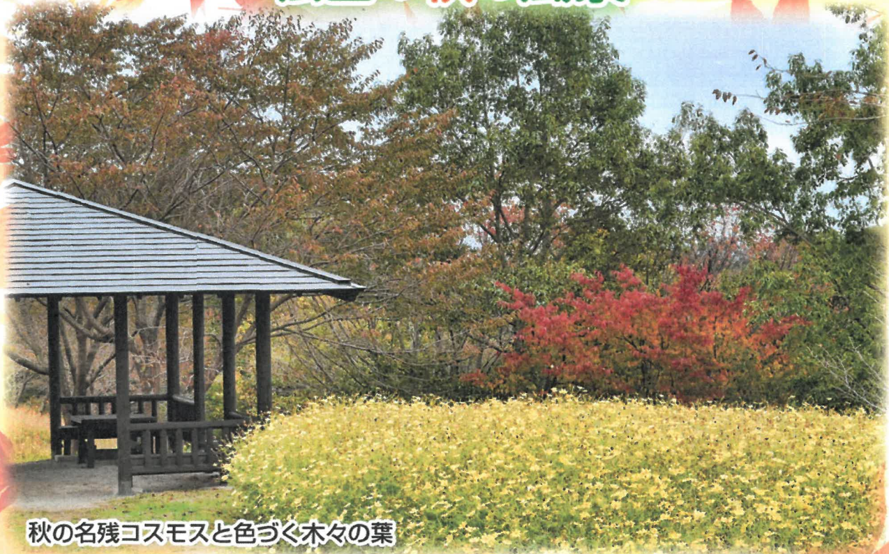
秋の名残コスモスと色づく木々の葉