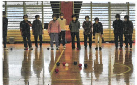
皆さん楽しそうです (ボッチャ)