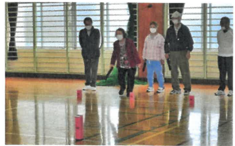
初めてやってみました!! (クップ)

コロナ禍の中でマスク着用ではありますが、笑いと歓声に包まれた講習会になりました。