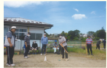
目指せホールインワン

6月4日、茶釜台親睦会事業の一つである班対抗グラウンド・ゴルフ大会が行われました。当日は朝6時からの行政区内の清掃作業を終えて会場のスポーツ広場に集合。晴天の下、子どもを含めた31名が参加し、和気あいあいを楽しみました。これからもコミュニケーションを高める事業に取り組んでいかれるそうです。