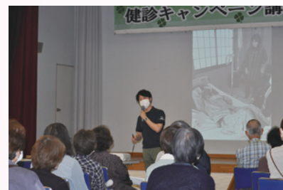
自分らしく生きるには

専門の先生だからこそのお話を聞くことができました。ホームドクターの必要性や在宅ケアはチーム（本人・家族・医師など）だということなど、参加された皆さんはそれぞれの立場で色々な想いをもたれたようでした。参加記念品として部会員手作りの小物入れを全員に差し上げました。