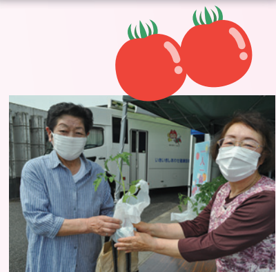
美味しく育てて下さいね

地域の皆さんの受診率アップとトマト（野菜）を食べて健康アップを目指してこれからも元気な松山のため活動していきます。