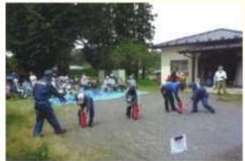
皆さんと防災訓練

また、社会福祉協議会松山支所による災害ボランティアセンターの活動事例や地域防災を支え合う内容の講話をいただきました。当日は、他の行事と重なっていましたが70名の区民の皆さんが参加し、防災に関する意識の高まりを感じました。