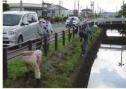
みんなできれいに

毎年、春にきれいなピンク色の可憐な花を咲かせて通行人を癒してくれました。来年もまたきれいな花が咲くように願いながら汗を流しました。9月には次に向けての植栽を予定しています。