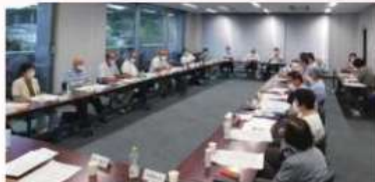
問題解決への一歩

昨年9月に3年ぶりに意見交換を行い、まちづくり協議会から市へ要望していた14項目に対する回答（現状や考え方）を説明していただきました。長年の課題となっている冠水対策については、具体的な進捗状況をお聞きして着実に前に進んでいることを実感しました。このような話し合いから意見のすり合わせをして、少しでも住みやすい『松山』にしていくように、お互いの理解と協力でまちづくりをしていくことを改めて確認しました。