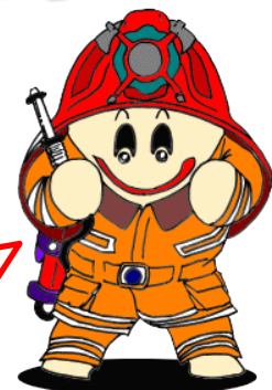
大崎広域消防 マスコットキャラクター 「らいすくん」