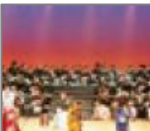
三絃小田島流社中