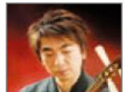
三絃小田島流家元 二代目小田島徳旺