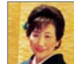
民謡歌手 平山 清子