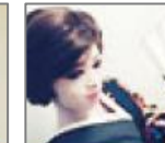
萌乃会 二代目 萌 翔