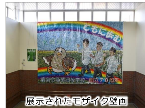
展示されたモザイク壁画