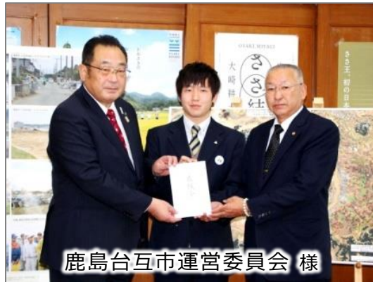
鹿島台互市運営委員会 様