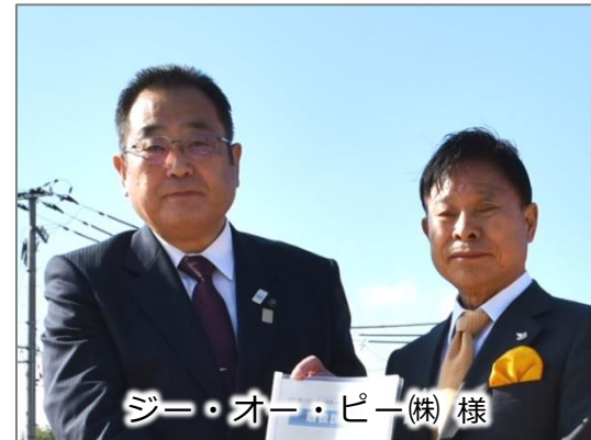
ジー・オー・ピー(株) 様