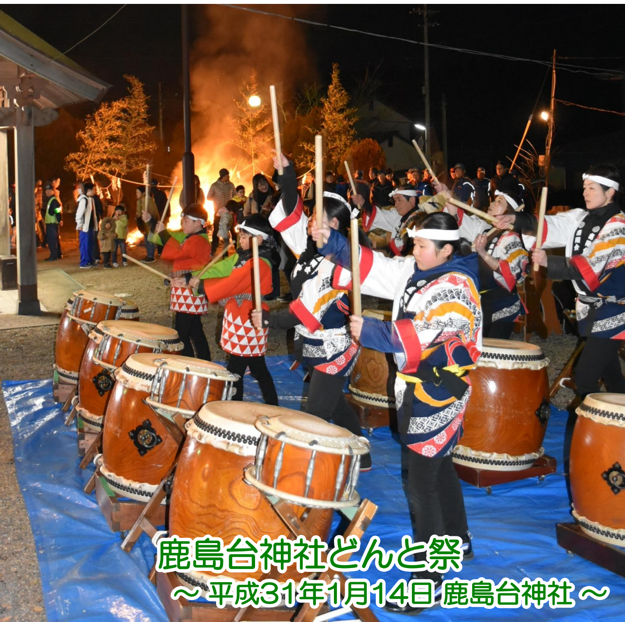
鹿島台神社どんと祭 ～平成31年1月14日 鹿島台神社～

新年あけましておめでとうございます。 本年もよろしくお願ひいたします。 鹿島台総合支所 職員一同