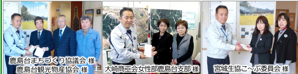
鹿島台まちづくり協議会 様 鹿島台観光物産協会 様