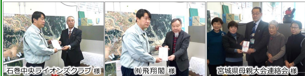
石巻中央ライオンズクラブ 様