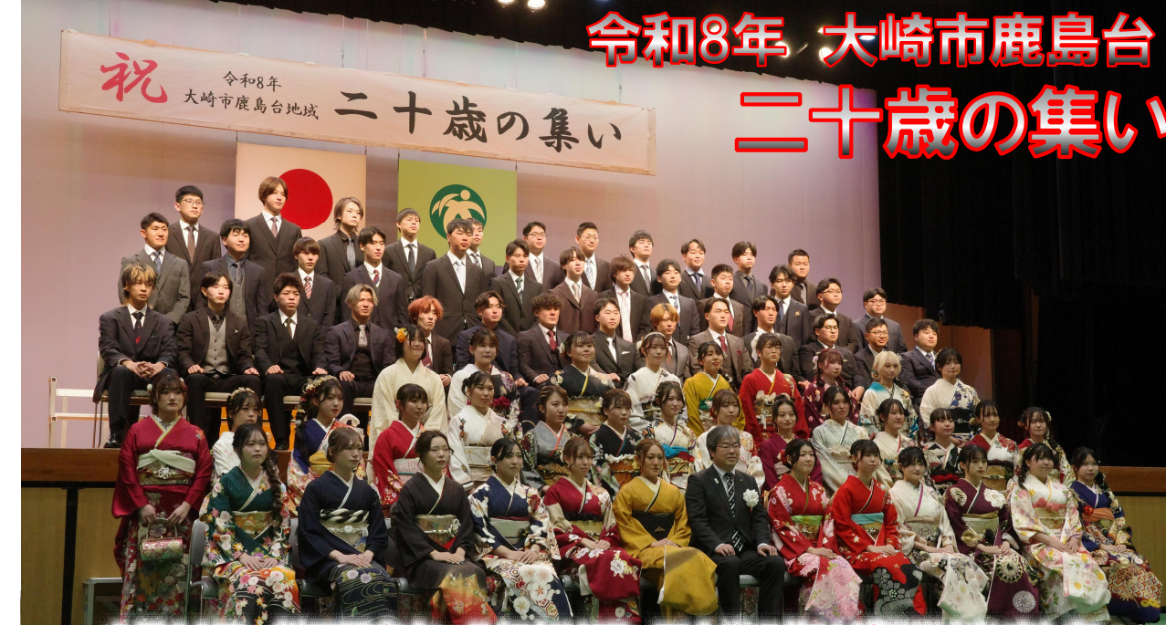
1月11日、鎌田記念ホールにおいて、二十歳の集いが開催されました。今年、鹿島台地域では92名が晴れの日を迎えました。

※防寒着・上靴・下足入れは各自持参してください。【お問合せ】鹿島台小学校 ☎56-2662