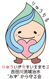
りゅうちる 吉田川流域治水 'みず' から守る会

流域治水オフィシャルサポーター 【主催】りゅうちるネットワーク ☎090-2883-5239