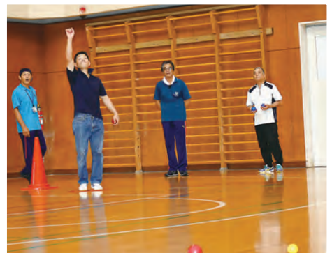
「三松鹿」で交流を さんしょうか 旧志田郡(三本木・松山・鹿島台)の合同企画

まちづくり協議会の誕生後、お互いの地域の課題等を共有し解決していこうと、三松鹿による合同事業が始まりました。