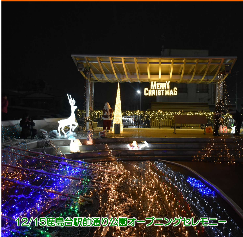
12/15鹿島台駅前通り公園オープニングセレモニー

新年あけましておめでとうございます。 本年もよろしくお願ひいたします。 鹿島台総合支所 職員一同