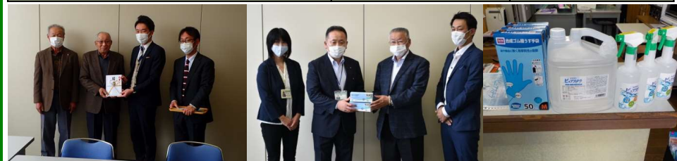
株式会社小野林業 様