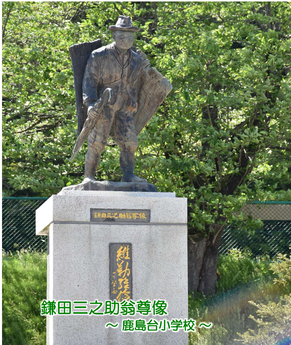
鎌田三之助翁尊像