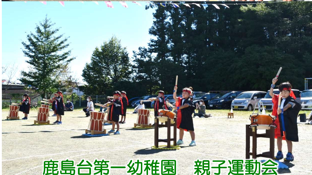
鹿島台第一幼稚園 親子運動会