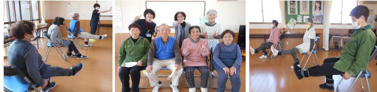
【お問合せ】市民福祉課 ☎56-9029

活動開始から4年になります！感染予防しながら毎週木曜日に集まって体操を続けています。メンバーが少なくなってきました参加者募集中ですので、気軽にご参加ください😊 クラブ一同、お待ちしております😊