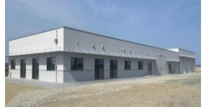
【お問合せ】地域振興課 ☎56-7111