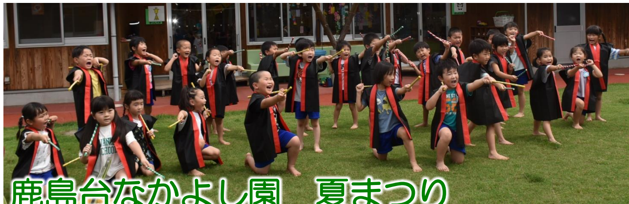
鹿島台なかよし園 夏まつり