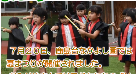
7月20日、鹿島台なかよし園では夏まつりが開催されました。

おみせやさんでは子どもたちの「いらっしゃいませー!」という元気な声がいっぱい聞こえてきて、とても楽しそうでした。