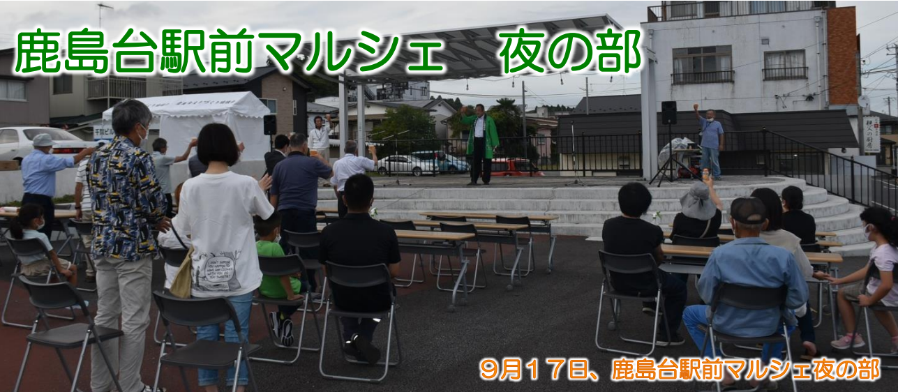
9月17日、鹿島台駅前マルシェ夜の部

が開催されました。フラダンスやジャズバンド演奏のイベントもあり、大変盛り上がっていました。