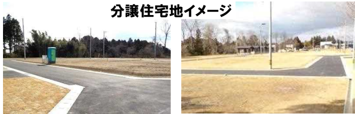
分譲住宅地イメージ