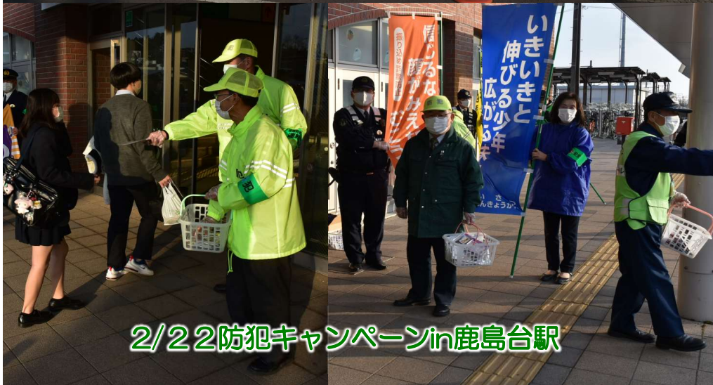
2/22防犯キャンペーンin鹿島台駅