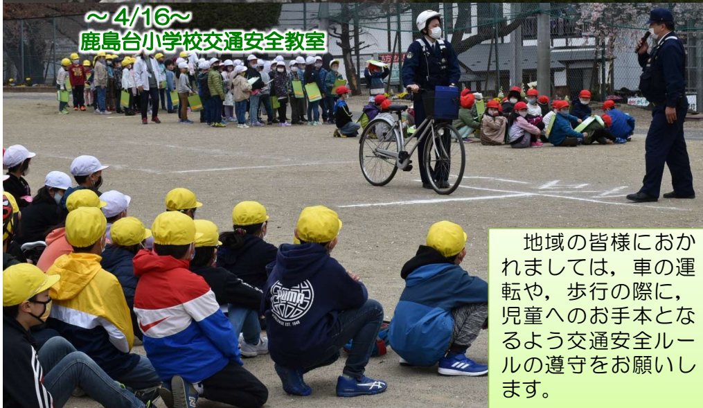
～4/16～ 鹿島台小学校交通安全教室

地域の皆様におかれましては、車の運転や、歩行の際に、児童へのお手本となるよう交通安全ルールの遵守をお願いします。