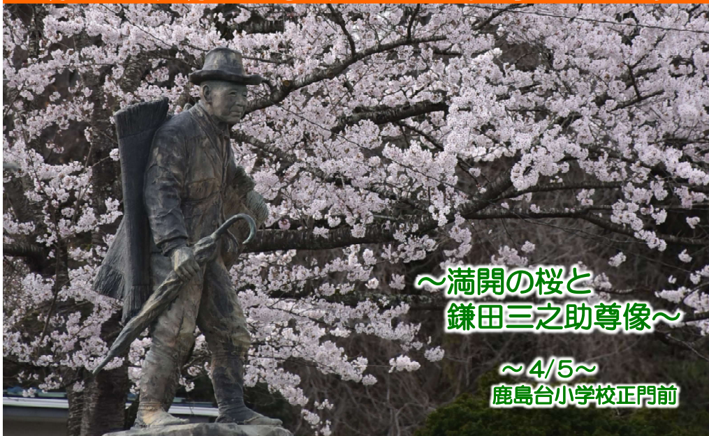
～満開の桜と 鎌田三之助尊像～