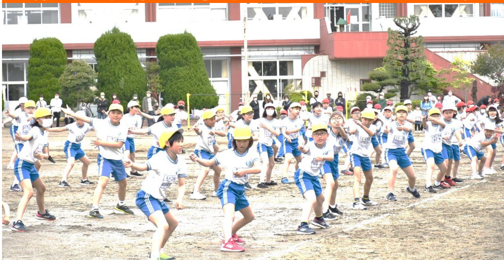
5/22 運動会 ～鹿島台小学校～